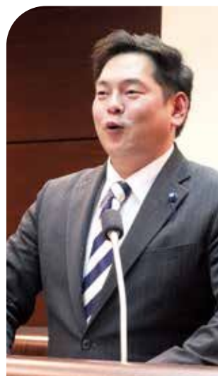
鈴木 千春 議員