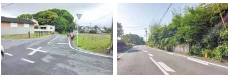
歩道設置の要望箇所

建設課長 地区から歩道設置の要望が上がっているが、町として事業に取り組んでいく決断はまだしていない。時間がかかるといふことで、カラー舗装や迂回路の対応を地区に話している段階であり、事業化の判断はできていない。