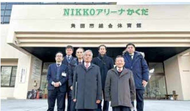
角田市スポーツビレッジにおいて

体に波及する重要な 施策であることを改 めて認識しました。 今後は、両自治体の 先進事例を参考にし ながら、本町の実情 に即したスポーツ振 興施策の検討と推進 に努めてまいります。