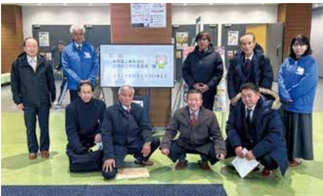
柴田町総合体育館にて

の高い企画力が生 かされており、開館 後も多様なイベント が継続的に実施され ています。総合体育 館は競技利用にとど まらず、市民の交流 や健康づくりの拠点 として、市民が主役 となる施設として活 用されています。ま た、総合型地域スポ