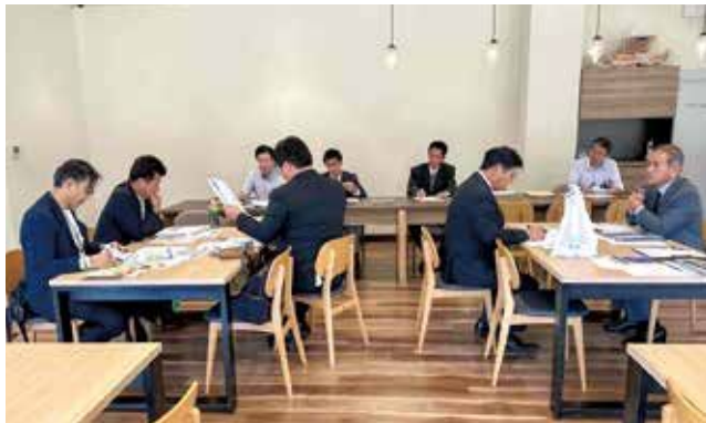
海南サクアスでの研修

キッズコーナーや多 目的室も完備されて います。キッチンも 整備されており、料 理教室や体験教室の 開催が可能です。運 営する指定管理者は リゾート施設などを 手掛け、首都圏や関 西圏を中心に217店舗 を展開しています。