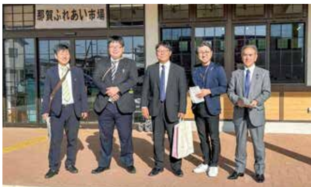
紀の川市道の駅「青洲の里」において