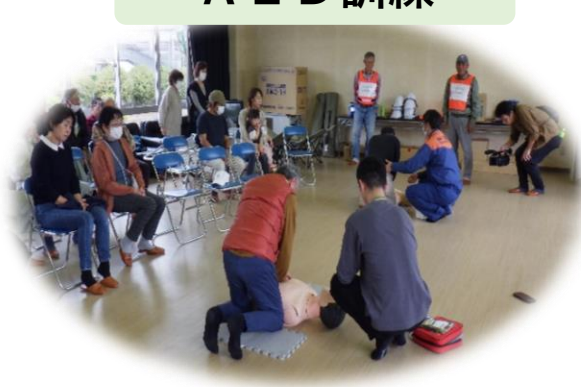
A E D 訓練