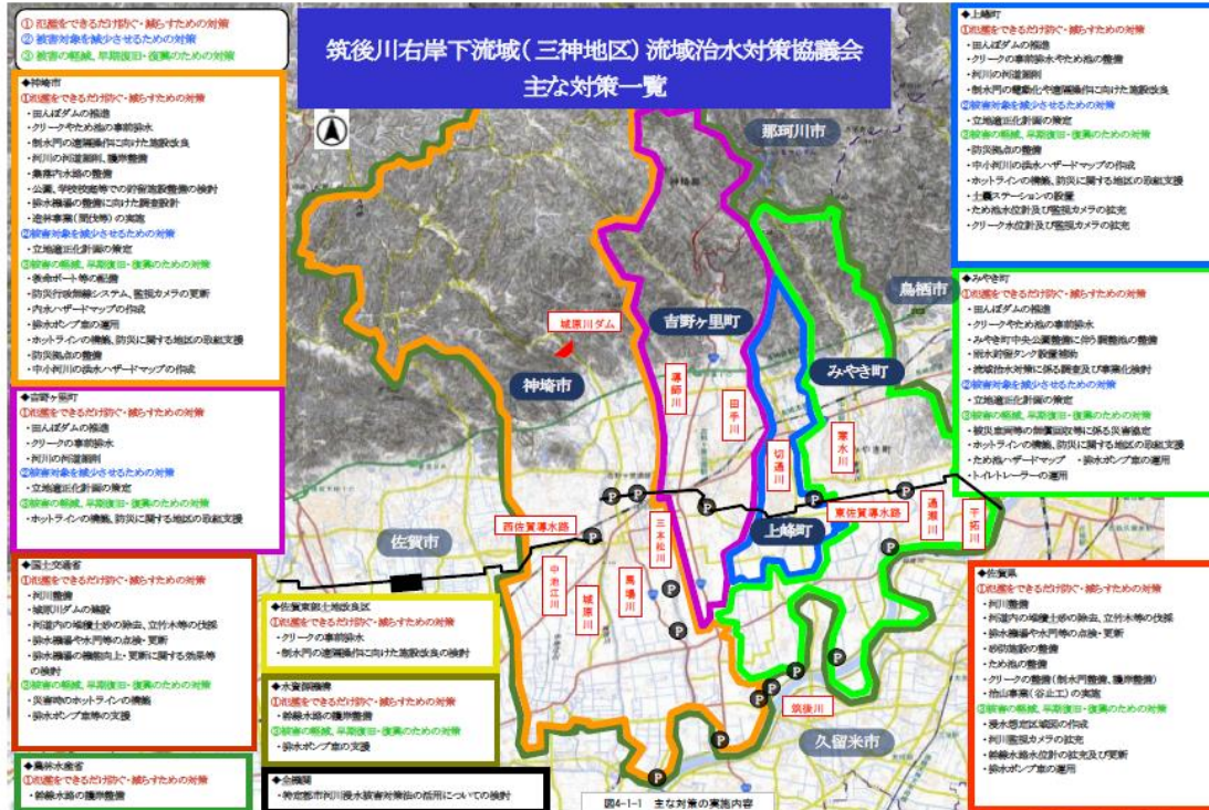
筑後川右岸下流域（三神地区） 流域治水協議会（R8.2.9発足）

神崎市・吉野ヶ里町・上峰町・みやき町等の筑後川右岸下流域（三神地区）のあらゆる関係者が協働して、流域全体で水害を軽減させる「総合内水対策計画」を策定し、これを計画的に推進するための新たな協議会を設置しました。今後、関係機関が調整を行いながら、事業の実現化に向けて連携していきます。