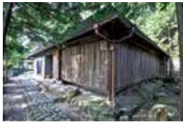
▲木ノ丸御殿を模して建てられた鼓岡神社(香川県)の擬古堂

保元の乱に敗れた崇徳上皇が流されたのは讃岐ですが、『椿説弓張月』の最後の場面となったのもここでした。琉球にいたはずの為朝が、今は亡き上皇の導きによって生きながら神となり、上皇の陵墓・白峰山陵前で殉死したとして幕を閉じるのです。 その上皇が生前暮らしていたのが、木ノ丸殿とも呼ばれる質素な小屋でした。ここに移り住む前は雲井御所で暮らしていましたが、ここでは綾の局という女性との間に子まで