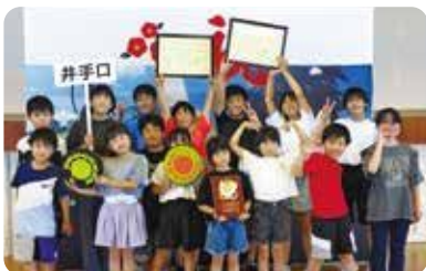
▲優勝した中の尾団地・新生チームBと準優勝した中の尾団地・新生チームA

優勝した中の尾団地・新生チームBは、町代表として8月に行われる県大会に出場予定です。