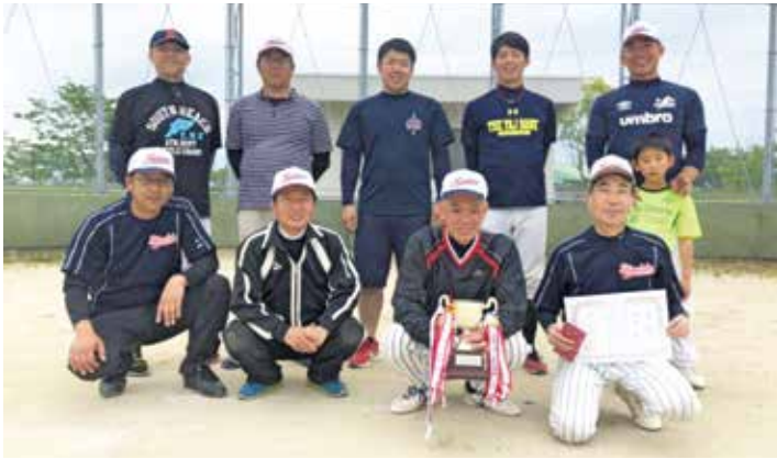
優勝の下津毛チーム