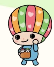
佐賀県子育て応援キャラクター さがっぴい