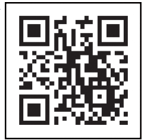
「コロナワクチンナビ」 二次元コード